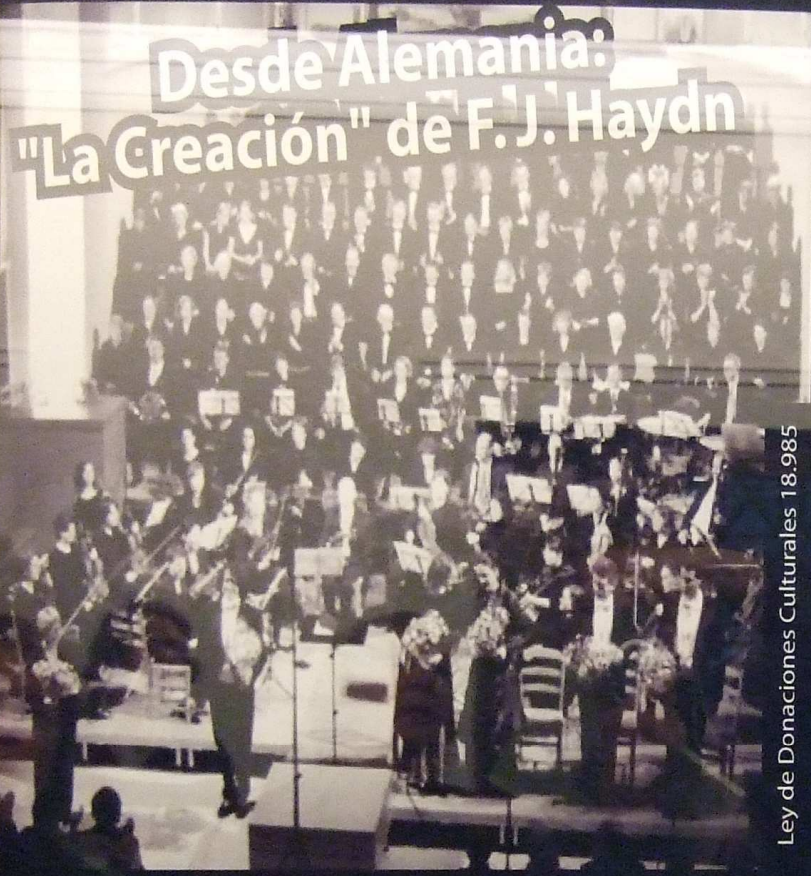
Ley de Donaciones Culturales 18.985